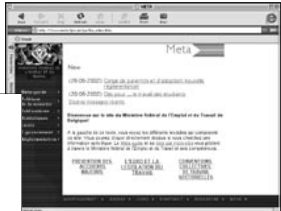
SAS helped the Ministry of Employment to transfer an IT-based system for the administration of collective agreements into an Intranet-based system.

information relating to a joint committee, the state of play of a particular dossier, or a search along thematic lines.