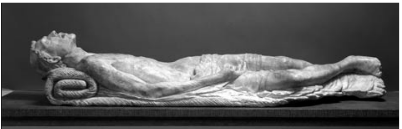
Jacques Du Broeucq