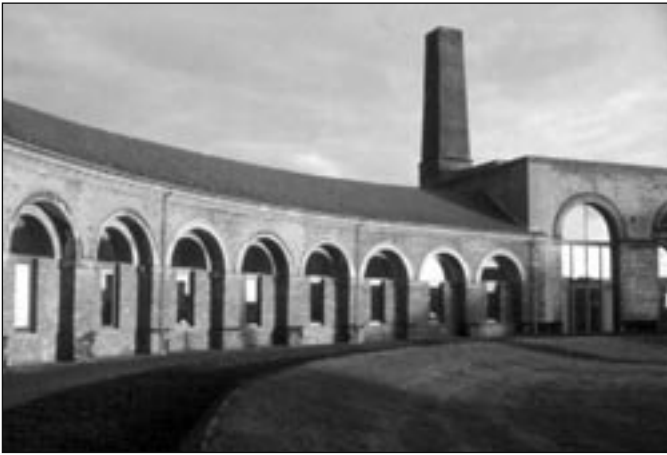
Vue des arcades