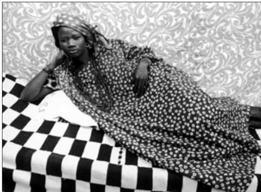
«Droits Réservés» - «Rechten Voorbehouden»

Op 3 november 1988 werd de eerste worm op het internet vrijgelaten. Deze worm was een applicatie die op zoek ging naar zwakbeveiligde machines en deze infecteerde. De applicatie kopieerde zichzelf razendsnel, waardoor ze zichzelf als een lopend vuurtje verspreidde. Dit proces ging door tot duizenden machines geïnfecteerd waren. In enkele uren tijd werd het hele internet zwaar onder vuur genomen. Programmeurs onderschepten kopieën van de applicatie en begonnen die te analyseren. De dader was Morris, een jonge informaticastudent wiens vader een ingenieur was bij een telefoonmaatschappij. Door een fout in zijn programma verspreidde en infecteerde de worm zich met een immense snelheid. Toen Morris zich realiseerde wat er aan het gebeuren was, schakelde hij een vriend in die