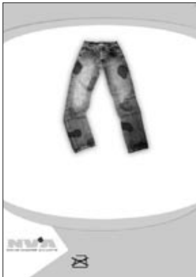
Fizz Campagne: NVA Titel: "op 90°"