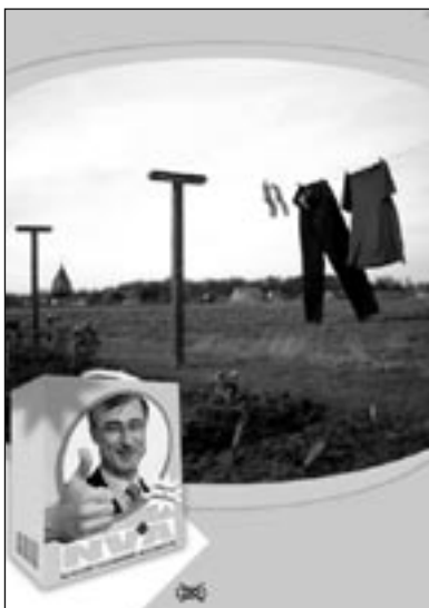
Fizz Campagne: NVA Titel: "op 90°"