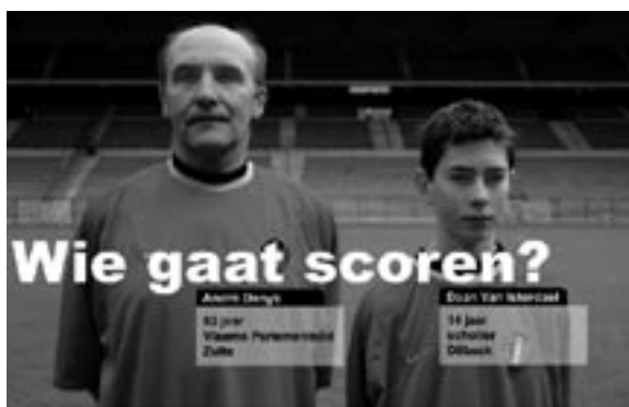
Fragment van de winnende campagne 2001 (tweede editie)

e-mail : ciriec@ulg.ac.be - http://www.ulg.ac.be/ciriec