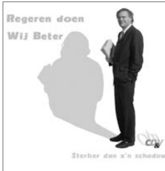
Beecom Campagne: CD&V Titel: "In de schaduw"