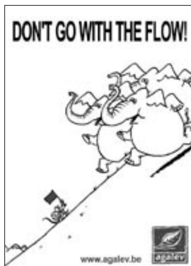
Minds on the Move Campagne: Agalev Titel: "Rebel"