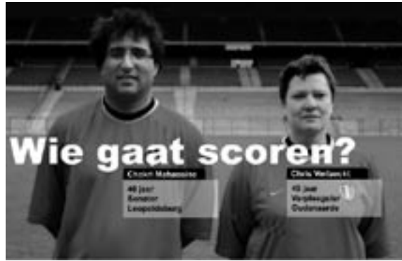
Fragment van de winnende campagne 2001 (tweede editie)