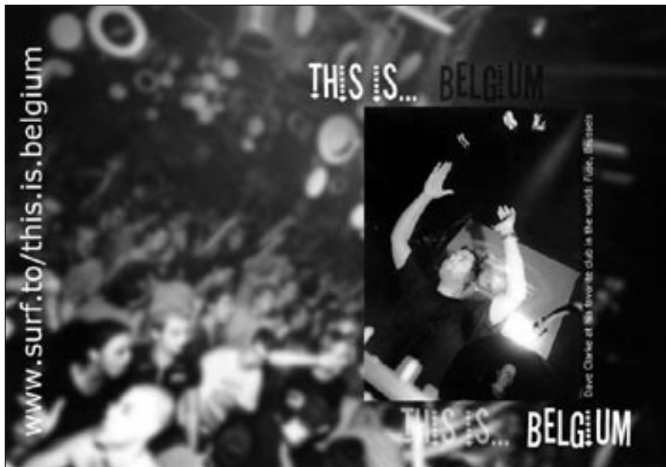
Fragment winnende campagne 2000 (eerste editie)

Het onderscheid tussen overheidsopdrachten van werken, leveringen en diensten is van groot belang, vermits de overheidsopdrachtenreglementering ter zake een aantal specifieke regels bevat. Zo zijn de bekendmakingsvoorschriften verschillend naar gelang het voorwerp van de overheidsopdracht (werken, leveringen of diensten). Voorts kan in het kader van dienstenopdrachten een soepeler gebruik worden gemaakt van selectiecriteria. In het kader van een dienstenopdracht kan ook gemakkelijker een beroep worden gedaan op de uitzonderingsregime van de onderhandelingsprocedure.