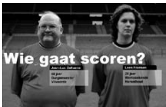
Fragment van de winnende campagne 2001 (tweede editie)

te geven om de vergunningen uit te reiken voor het organiseren van de paardenwedrennen en de weddenschappen. Paardenwedrennen zijn een regionale bevoegdheid omdat zowel de aspecten landbouw (fokkerij), sport (gemeenschapsmaterie sinds 1980), en spelen en weddenschappen (gewestelijke belasting zowel inzake aanslagvoet, heffingsgrondslag en vrijstelling) voor het Vlaamse grondgebied ressorteren onder de bevoegdheid van de Vlaamse overheid. Alleen de dopingcontroles op de dieren blijven een federale materie. Het vertrouwen in de sector willen we opnieuw herstellen door de oprichting van de Vlaamse Federatie voor Paardenwedrennen ("VFP") die gemachtigd wordt voor de uitreiking van de vergunningen aan de renverenigingen, wedkantoren, bookmakers en de totalisator. De Vlaamse Federatie moet de toekenning van de vergunningen verbinden aan voorwaarden op het gebied van transparantie, een goede financiële structuur, maatregelen voor een regelmatig koersverloop en voor het vermijden van belangenvermenging, en algemene promotie.