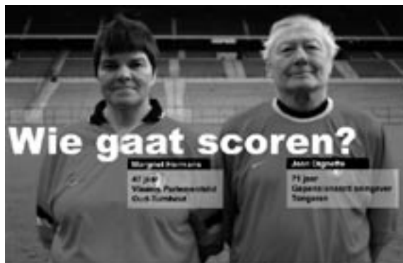
Fragment van de winnende campagne 2001 (tweede editie)

Par ailleurs, dans le cas de projets partiellement ou entièrement financés par des sources de revenus autonomes comme des droits de péage pour les autoroutes ou des frais de transaction pour l'octroi de permis, le risque lié au niveau de la demande peut être assumé en tout ou en partie par le secteur privé.