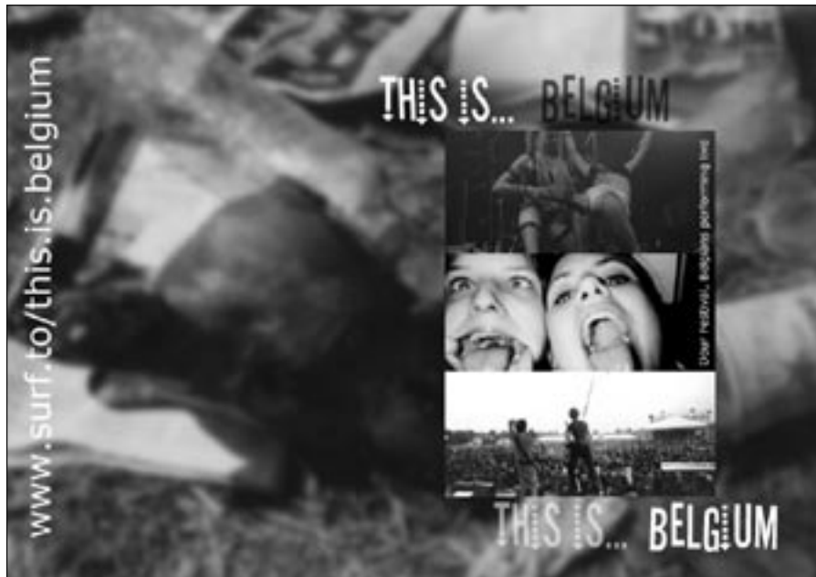
Fragment winnende campagne 2000 (eerste editie)

werk te helpen. Dat economische succes heeft zijn grenzen wel bereikt. Wel door slimmer te gaan werken. Ook een beetje harder, wat lastig is in het land van de korte werkweek en de uitpuilende verlofkaarten. We moeten nieuwe en betere producten maken.