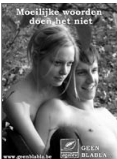
Standby Campagne: Agalev Titel: "10 voor taal"