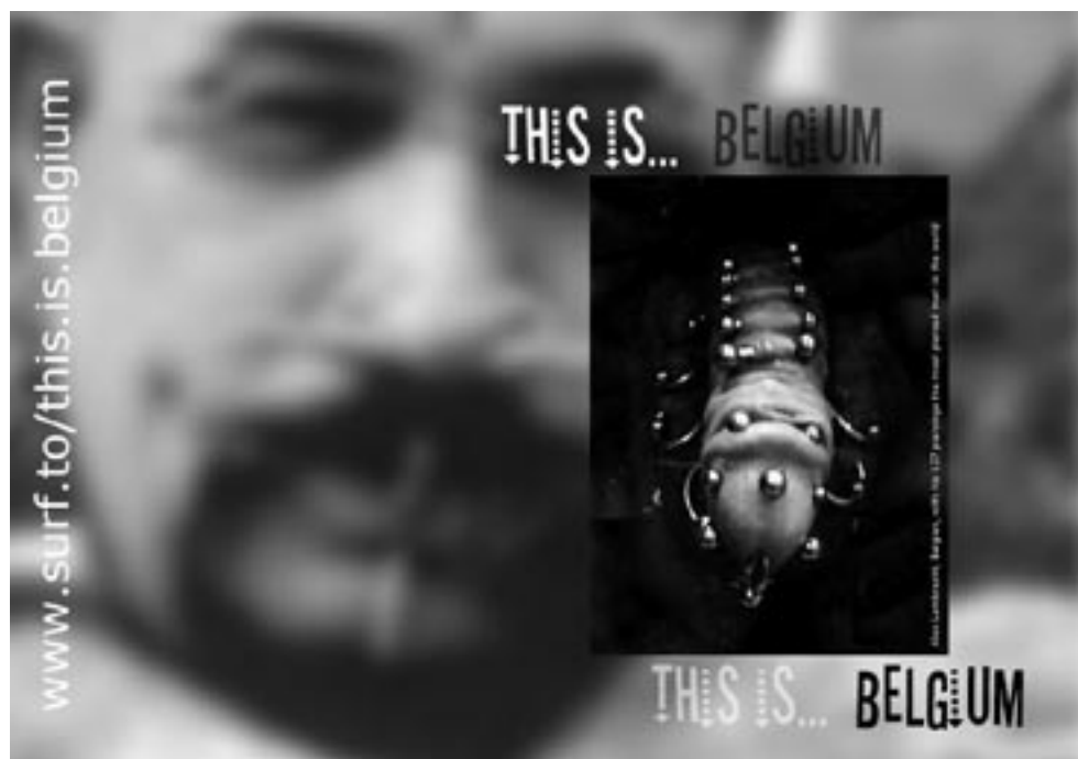
Fragment winnende campagne 2000 (eerste editie)

ULB - Avenue Roosevelt, 39 B-1050 Bruxelles