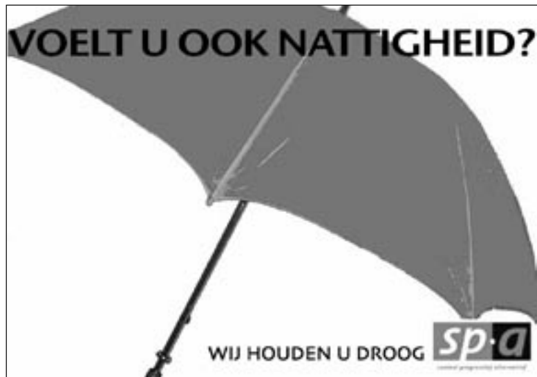
Tangram Campagne: Spa Titel: "Paraplucampagne"