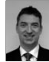
Peter Vanvelthoven Federaal Minister van Werk en Informatisering

• Fedict (Federale Dienst voor Informatie en Communicatie-technologie) dat verantwoordelijk is voor het beheer van het federale netwerk, maar ook zorgt voor de bouwstenen van het e-gov beleid. Alsmear meer richt deze dienst zich naar de informatisering van de samenleving.