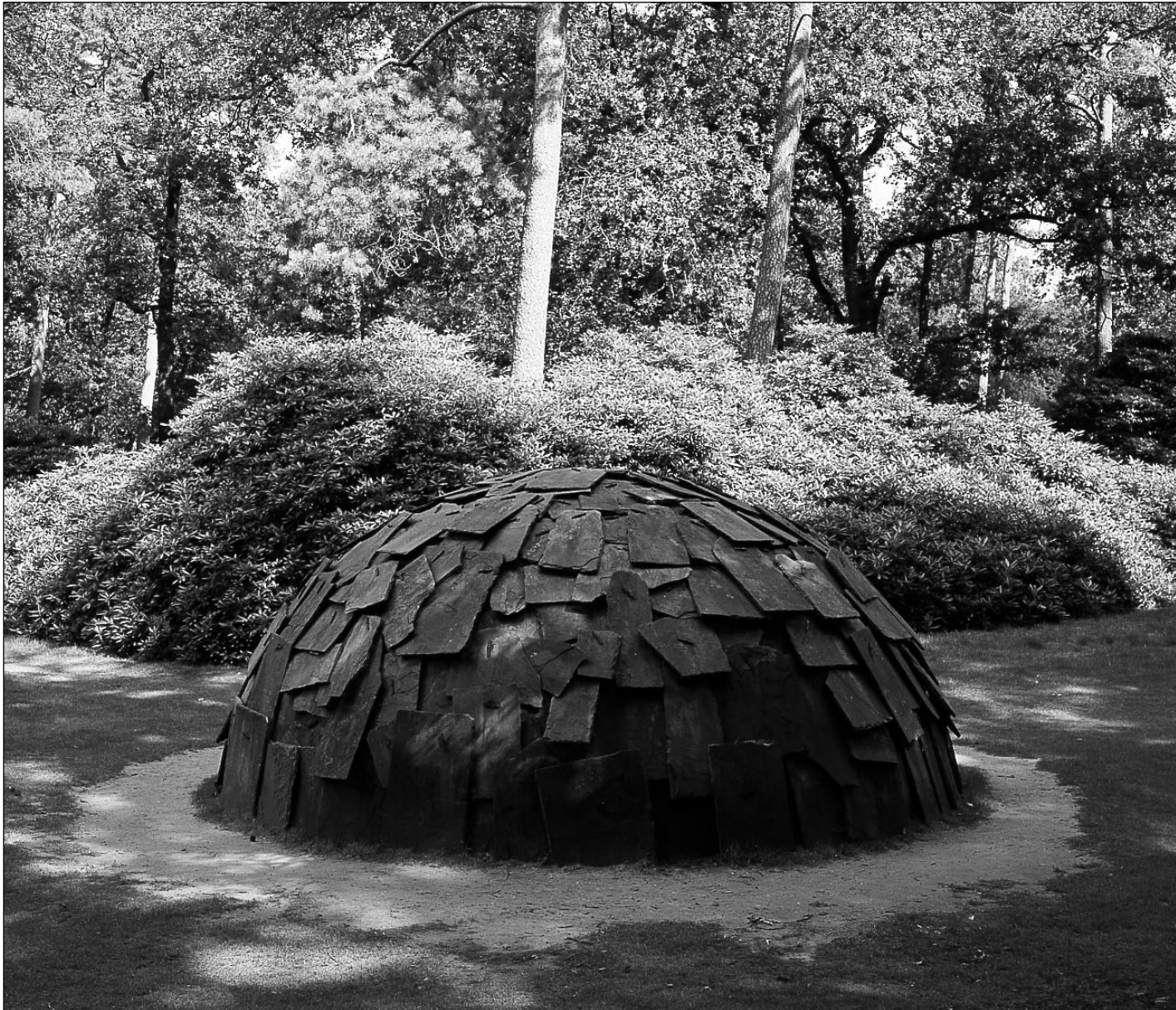
Titel: Igloo di Pietra Kunstenaar: Mario Merz Materiaal: aluminium en staal Datum: 1982 Code: KM 113.373