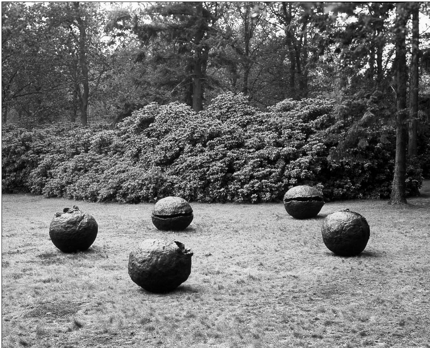
Titel: Concetto spaziale natura Kunstenaar: Lucio Fontana (1899-1968) Materiaal: brons Datum: 1959-1960 Code: KM 116.830