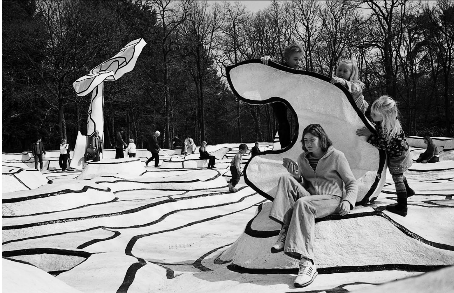
Titel: Jardin d'email Kunstenaar: Jean Dubuffet Materiaal: Beton, epoxy polyurethaan, verf Datum: 1974 Code: KM 117.265 © Kröller-Müller Museum, Otterlo Fotograaf: Walter Herfst, Rotterdam

Tenslotte moet er gewerkt worden aan de mentale instelling van de oudere werknemer. Ook bij hem moet de overtuiging groeien dat langer werken een positief effect heeft op zijn financiële toestand,” besluit prof. Sels.