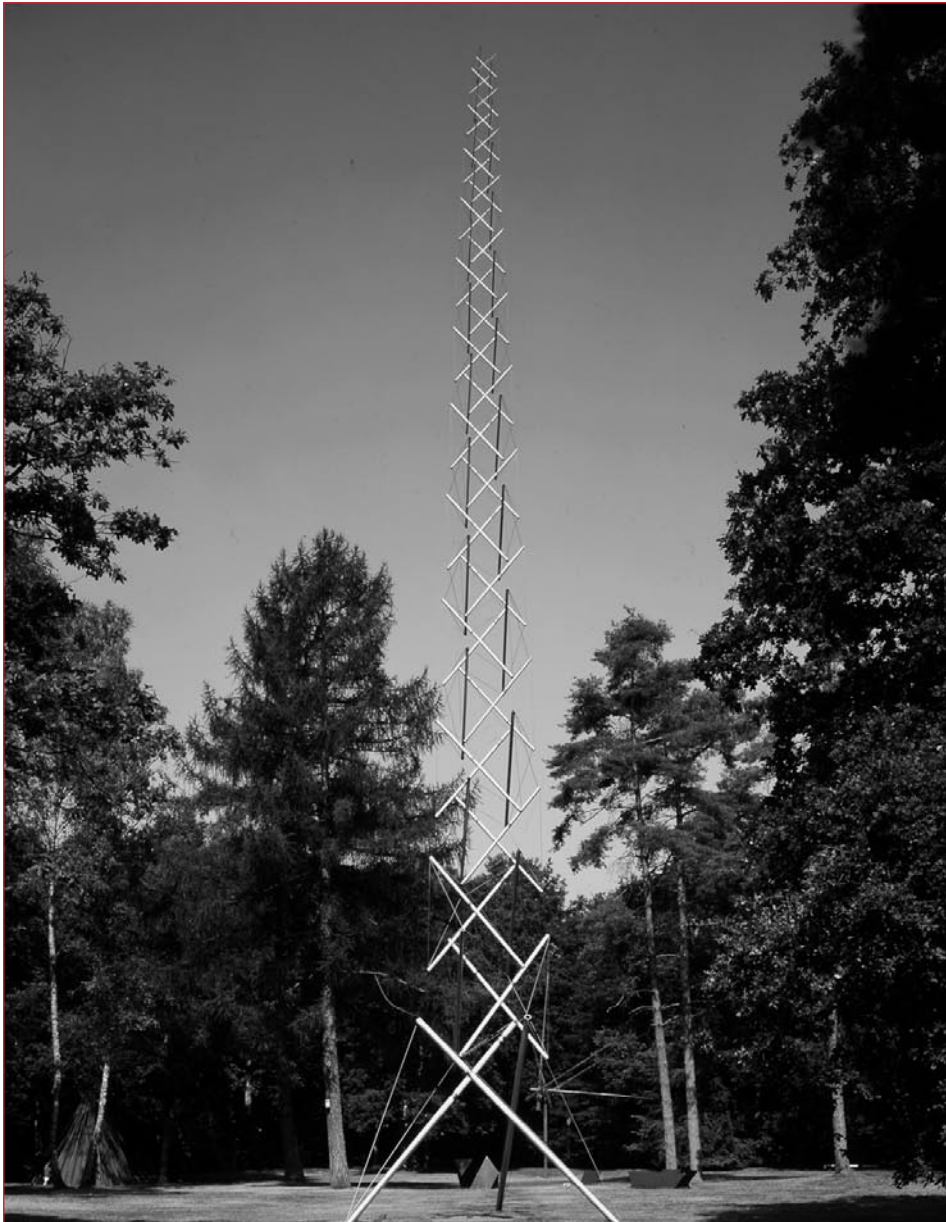
Titel: Needle Tower Kunstenaar: Kenneth Snelson Materiaal: aluminium en staal Datum: 1968 Code: KM 115.996