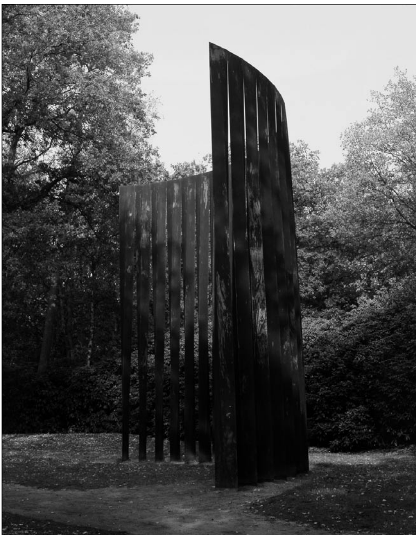
Titel: Palissade Kunstenaar: Evert Strobos Materiaal: Cortèn-staal Datum: 1973/1991 Code: KM 120.218 © Kröller-Müller Museum, Otterlo