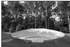
Titel: Amfitheater Kunstenaar: Marta Pan, 1923 Materiaal: graniet Datum: 2005-2007 Code: KM 131.145